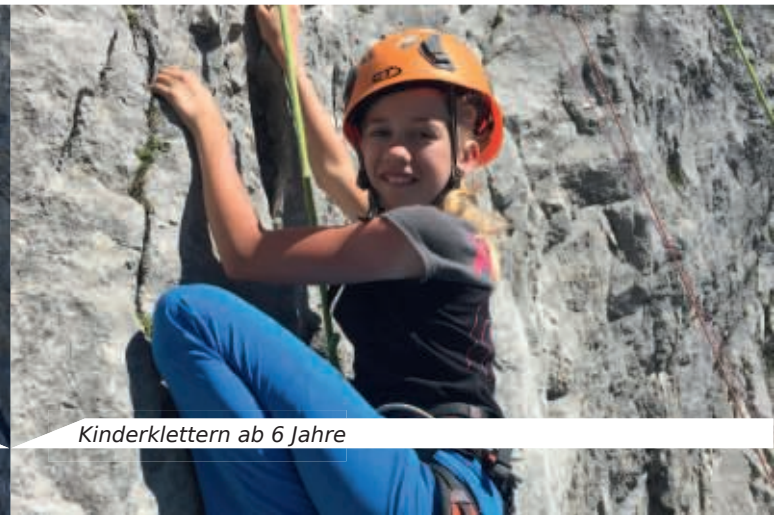
Kinderklettern ab 6 Jahre