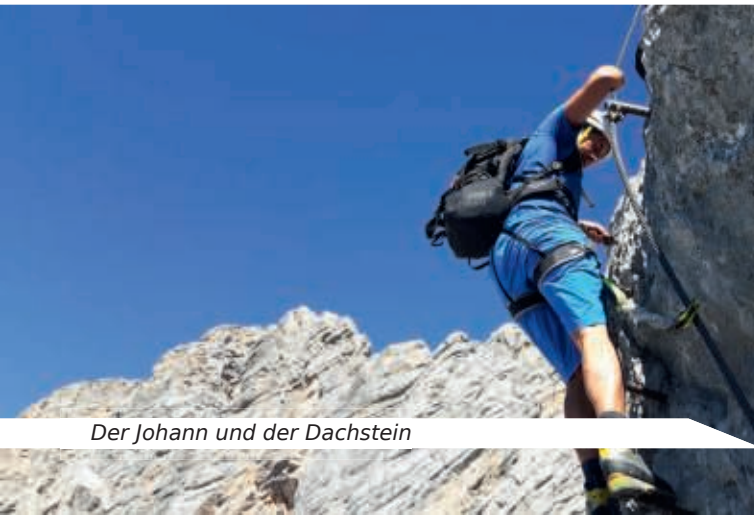
Der Johann und der Dachstein