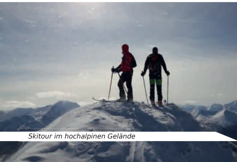
Skitour im hochalpinen Gelände