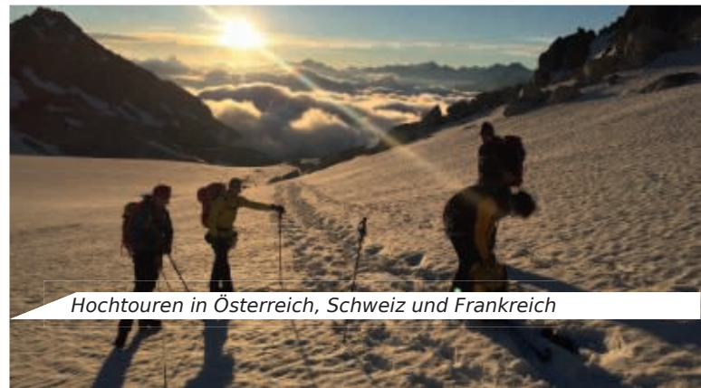
Hochtouren in Österreich, Schweiz und Frankreich