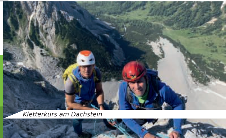
Kletterkurs am Dachstein